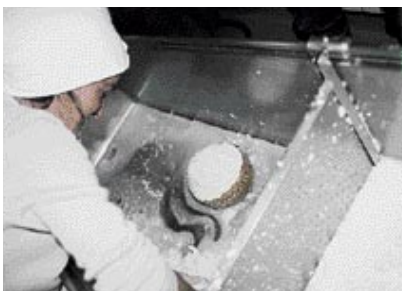
El queso permanece en el obrador de 6 a 7 horas a una temperatura de 22° hasta que ha soltado todo el suero.