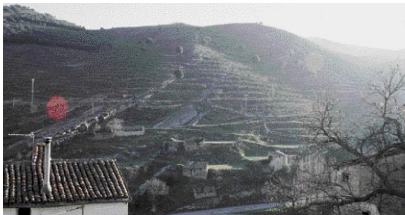
Vistas de Munilla desde la quesería La Aulaga.