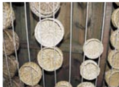
Cocido (en la fotografía de la izquierda) y secado de las cillas.

6 ó 7 horas a una temperatura de 22 a 24°. Una vez se ha extraído todo el suero, el queso se introduce en una salmuera (concentración de agua con sal) durante 12 horas (dependiendo del peso, en este caso de un kilo).