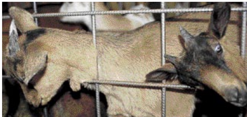
La cría con cabritos propios y el cruce con razas puras ha permitido homogeneizar las características de todo el rebaño.

1. La alimentación natural que adquieren cada día en el campo se complementa en el corral con un suplemento a base de cereal: avena, maíz, habas, alfalfa deshidratada y guisante. "La cabra tiene buena muela, come mucha fibra en el campo, leña y materia dura que digiere muy bien y luego, en el corral, lo complementamos con un aporte vitamínico natural. Harina no les damos porque la digieren peor, ni