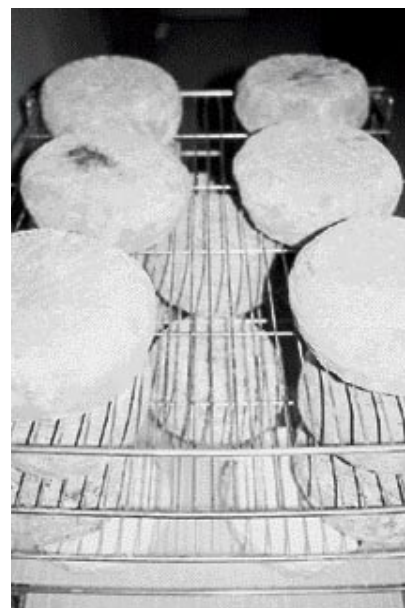
El queso La Aulaga madura dos meses en una sala donde se controla la humedad y la temperatura.